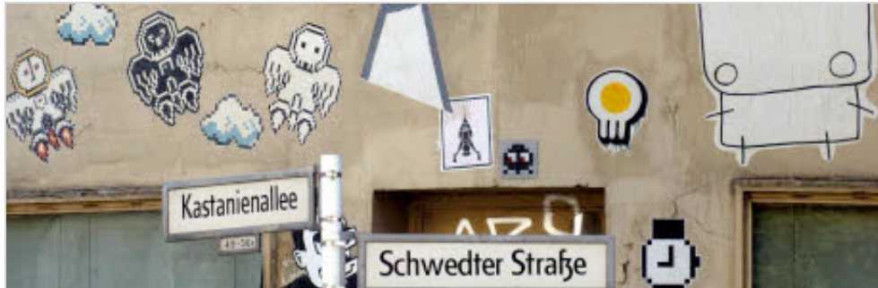
Street Art in Berlin

Der Junge kniet auf dem Boden, die gefalteten Hände an die Nasenspitze gelegt, den Kopf mit der Basecap gesenkt. Schwarz-weiß, bis auf den Inhalt des Farbeimers vor ihm. In grellrosa schreien die Worte von der Wand: "Forgive us our trespassing". Es ist eines der Werke des populären britischen Künstlers Banksy, auf einer Mauer in Salt Lake City.