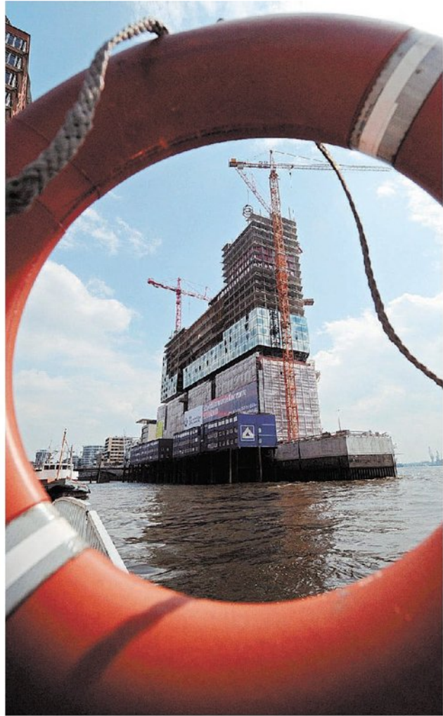
Maler-Star Neo Rauch in seinem Atelier in der Leipziger Baumwollspinnerei. Die Elbphilharmonie wird Hamburgs neue Landmark