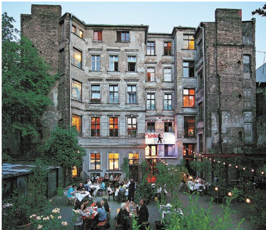
In Clärchens Ballhaus feiern auch Künstler wie Jonathan Meese gern. Das Tanzhaus in der Berliner Auguststraße besteht seit 1913