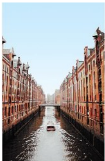
Die Hamburger Speicherstadt gehört erst seit 2004 auch zollrechtlich zur EU.

Weiterführende Informationen zu Lifestyle, Design, Kunst und Architektur in deutschen Städten wie Hamburg, Berlin und Leipzig gibt es auch unter www.creative-germany.travel . Allgemeine Infos zu Reisen nach Deutschland unter www.germany.travel .