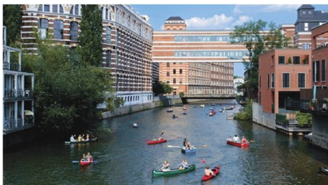
Zum Kanufahren vor der Kulisse der Industriearchitektur lädt der Leipziger Stadtteil Plagwitz