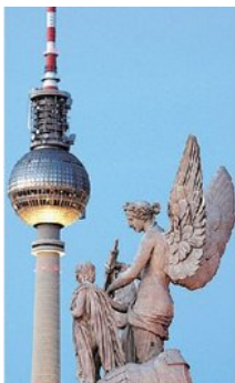
Blick auf den Fernsehturm neben dem Berliner Alexanderplatz in Berlin Mitte.

Gut und trotzdem gesund essen ist auch irgendwie schick, das bläuen einem unter anderem die deutschen Fernsehköche regelmäßig ein. Und Hamburg ist ein regelrechter Hort für telegene Küchenmeister: Christian Rach eröffnete eines seiner ersten Restaurants nahe des Altonaer Hafens in Hamburg. In unmittelbarer Nachbarschaft hatte auch Tim Mälzer sein erstes Mini-Restaurant. Mälzer betreibt heute mit der „bullerei“ auf einem ehemaligen Schlachthofgelände im Schanzenviertel ein angesagtes Restaurant mit angeschlossenem TV-Studio.